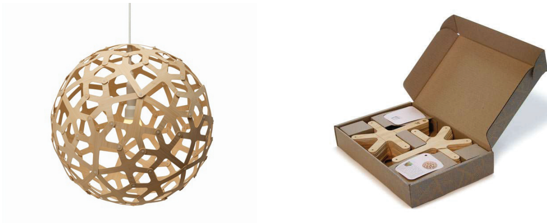
Figura 8: Lámpara Colgante de Coral

[Fuente: Lámpara Colgante de Coral con el kit de automontaje: Seed System Kitset Packaging ( www.davidtrubridge.com )]