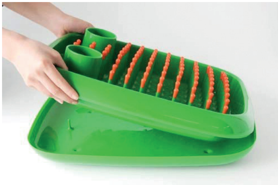
Figura 3a: Escurrer platos Dish Doctor mostrando dos piezas moldeadas por inyección

[Fuente: DISH DOCTOR diseñado por Marc Newson para MAGIS, 1997]