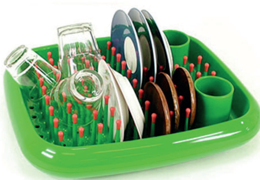
Figura 3b: Uso del escurrer platos Dish Doctor

[Fuente: DISH DOCTOR diseñado por Marc Newson para MAGIS, 1997]