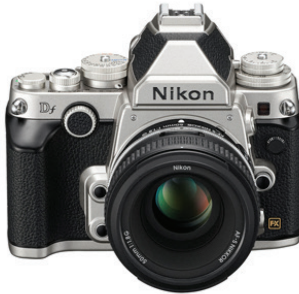
Figura 4: Nikon DF (2013)