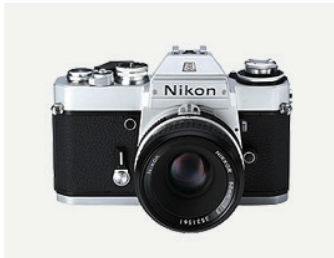
Figura 5: Nikon EL2 (1977)